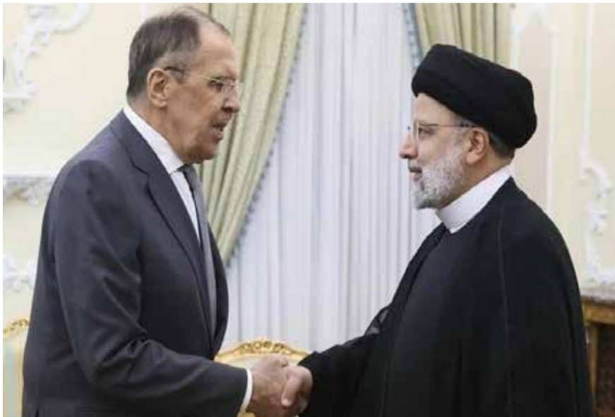
俄羅斯外長拉夫羅夫周一在德黑蘭會見伊朗總統萊希資料圖片

中華新聞通訊社/中華時報在俄羅斯入侵烏克蘭滿一週年后繼續共同推出專題，以饗讀者，從各個方面探討，讓大家瞭解俄烏戰爭怎麼發展、結局如何和這個21世紀的重大事件。