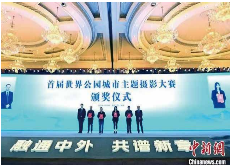
24日下午，首屆世界公園城市主題攝影大賽頒獎儀式在蓉舉行。

中新網成都10月24日電(記者 賀劭清)第十一屆世界華文傳媒論壇24日在成都落下帷幕。閉幕式上舉行了首屆世界公園城市主題攝影大賽頒獎儀式。