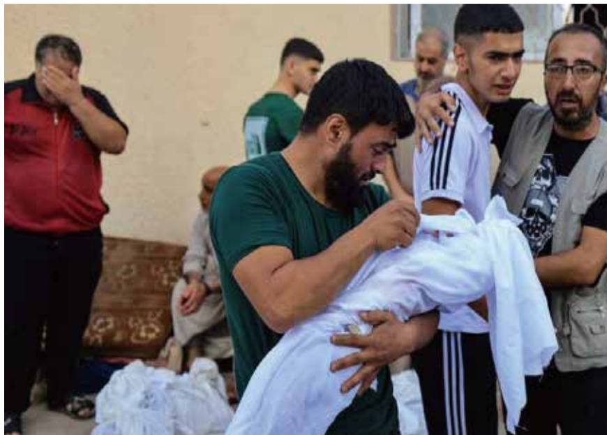
國際組織救助兒童會表示，加薩走廊已有2000名小孩在以色列空襲下喪生。圖為加薩1名父親悲痛地看著小孩遺體。

普京在2020年的一次採訪中，否認了外界流傳已久「普京有替身」的說法，不過他也表示，出於安全因素，他其實有過使用替身的機會。