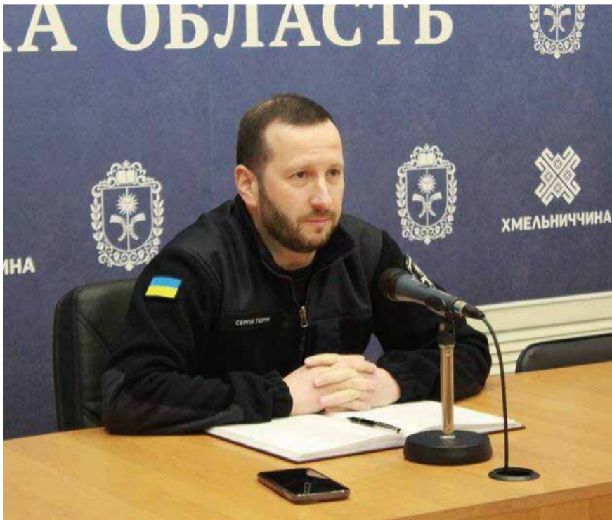
赫梅利尼茨基州副州長狄由林表示，俄方無人機被擊落後，機身碎片損壞了該州關鍵基礎設施。