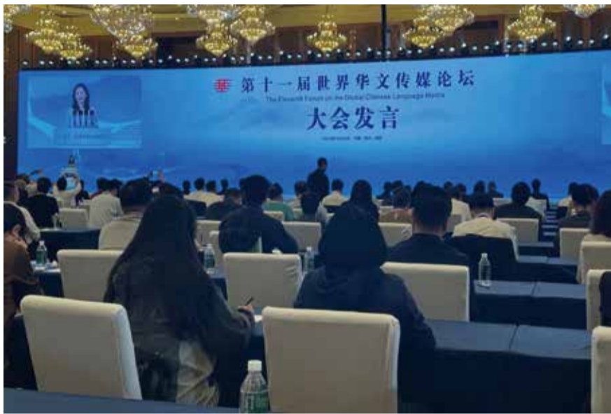
閉幕式前，9位華文媒體代表進行了大會發言，從自身經歷分享收穫感悟。