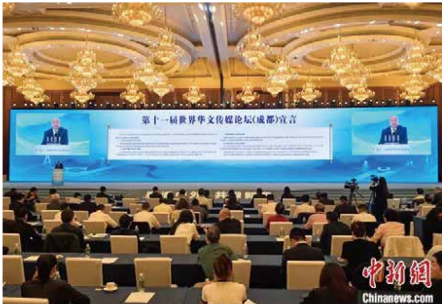
圖為中國新聞社總編輯張明新在閉幕式上宣讀《成都宣言》。

(中華新聞通訊社/中華時報成都10月24日訊)第十一屆世界華文傳媒論壇24日在成都落下帷幕。來自五大洲59個國家和地區的近300家華文媒體代表人士參加論壇，以“融通中外，共譜新章”為主題，論壇期間，來自59個國家和地區的300多家華文媒體代表盡抒所見，展開對話交流，凝聚共識，達成《成都宣言》。中國新聞社總編輯張明新在閉幕式上宣讀了宣言。