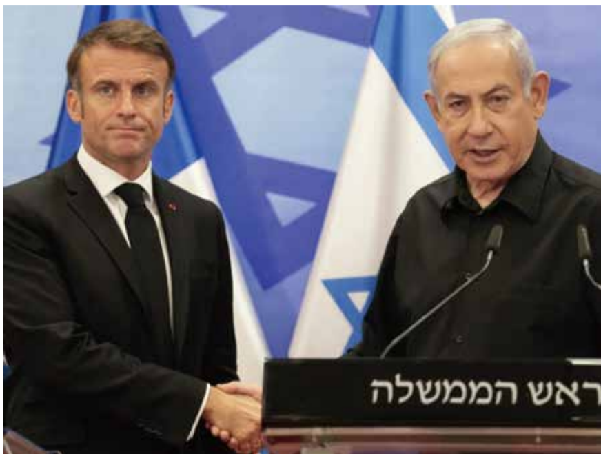
馬克龍與內塔尼亞胡會面時說，恐怖主義是以色列和法國的共同敵人。