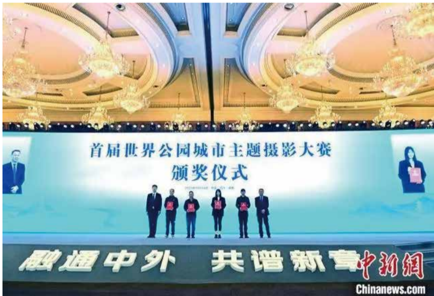
24日下午，首屆世界公園城市主題攝影大賽頒獎儀式在蓉舉行。