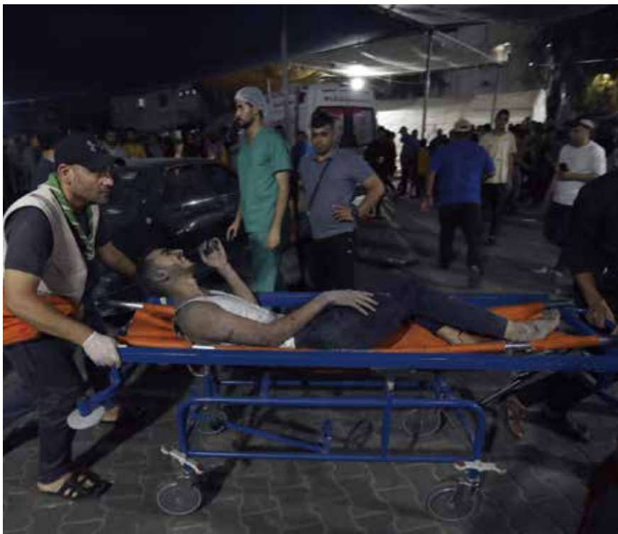
在以軍空襲加沙中,一名傷者送院治療。

(中華新聞通訊社/中華時報10月27日訊)以巴衝突持續,加沙衛生部說,超過7000名巴勒斯坦人在以軍多天以來的空襲中死亡,包括2900多名兒童。衛生部公布超過200頁文件,列出死者的姓名和身份證號碼,說每個數字背後都是人的故事。聯合國大會就以巴衝突恢復召開第十次緊急特別會議,預料當地周五將表決約旦代表阿拉伯國家提交的決議草案。