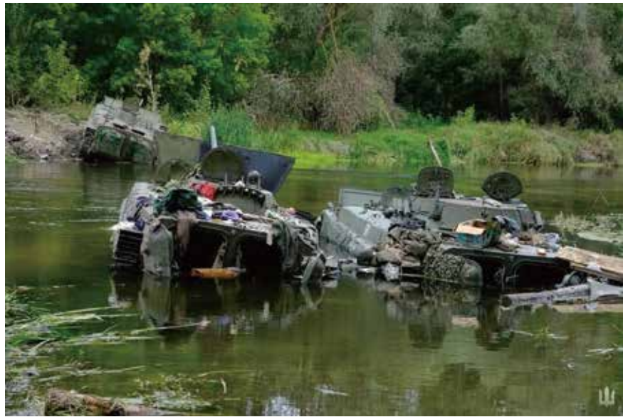
圖為去年俄軍丟棄戰車裝備。

中華新聞通訊社/中華時報在俄羅斯入侵烏克蘭滿一週年后繼續共同推出專題，以饗讀者，從各個方面探討，讓大家瞭解俄烏戰爭怎麼發展、結局如何和這個21世紀的重大事件。