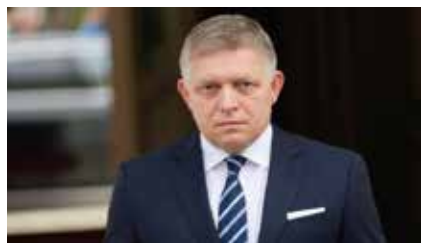
斯洛伐克宣布停止向烏克蘭提供武器

菲佐先生在被任命為聯合政府首腦第二天宣布：“我們認為，對烏克蘭的援助只是人道主義和民事援助，我們將不再向烏克蘭提供武器”。他的聯合政府包括親俄極右翼政黨。