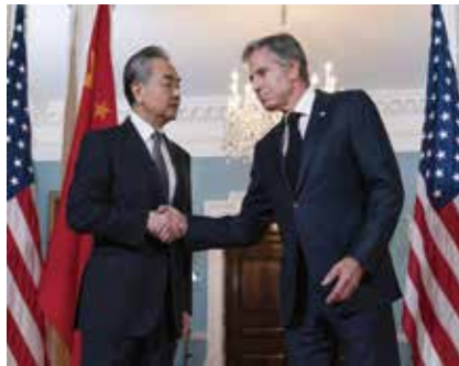
王毅在華盛頓與布林肯會談。

(中華新聞通訊社/中華時報10月27日訊)訪美的中共中央政治局委員、外長王毅在華盛頓與美國國務卿布林肯會談。王毅在會前說,中美兩個大國有分歧矛盾,也有重要共同利益,雙方共同面對挑戰。中美雙方需要恢復深入、全面對話,增進相互了解,消除誤解誤判,不斷尋求擴大共識,開展互利合作,推動雙邊關係,止跌企穩,盡快回到健康、穩定、持續發展軌道。