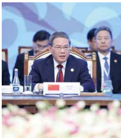
李強出席上合會議期間與多國領袖會晤。

(中華新聞通訊社/中華時報10月27日訊)國務院總理李強在吉爾吉斯出席上合組織會議。