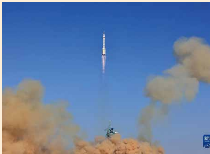
神舟十七號3名太空人順利進駐太空站。

（中華新聞通訊社/中華時報10月26日訊） 神舟十七號載人飛船上午在酒泉衛星發射中心發射升空，飛船入軌後，在傍晚5時46分，成功對接中國太空站天和核心艙前向端口，整個對接過程歷時約6.5小時，3名太空人順利進駐太空站。