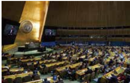
聯合國大會就以巴衝突恢復召開緊急特別會議。

埃及傳媒引述消息人士報道,一枚火箭彈擊中埃及紅海度假勝地塔巴靠近以色列邊境一處醫療設施,造成6人受傷。