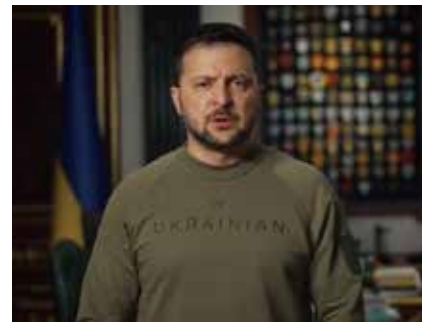
澤倫斯基感謝美國軍援。

美國國務院發布的聲明稱，新一輪向烏克蘭提供的軍援包括防空系統、火炮彈藥及反坦克武器，總值1.5億美元。