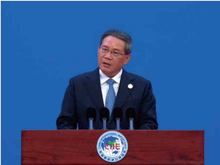
李強表示，要持續推進規則對接更好的開放，推進制度性開放是中國擴大高水平對外開放的重要舉措。

據英國《金融時報》周六報導，美國蓋洛普諮詢公司正在退出中國市場。彭博社也於近日報導，美國資產管理巨頭先鋒集團正在邁出撤離中國的最後一步。它們成為北京收緊對企業的國安審查以及地緣政治日益緊張下撤出中國的最新外企。在歐洲企業批評中國商業環境需要更多實質性改善之際，中國總理李強在中國國際進口博覽會上表示，將進一步擴大市場准入並保護外商投資權益。