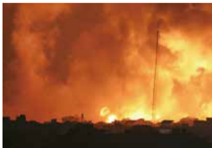
巴勒斯坦傳媒報道，加沙星期日遭受以軍前所未有的轟炸，中部再有兩個難民營遭空襲。

（中華新聞通訊社/中華時報11月5日訊）加沙中部兩個難民營遭到以軍戰機空襲，據報造成至少53人死亡，幾十人受傷。當地的馬加齊難民營星期六亦遭到空襲，造成近50人死亡。巴勒斯坦傳媒報道，加沙星期日遭受以軍