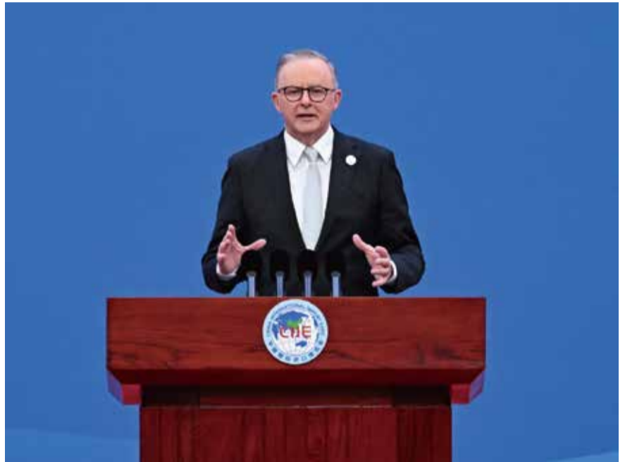
阿爾巴內塞在上海出席進博會開幕儀式，並發表簡短演說。

澳洲總理阿爾巴尼斯曾表示，該國不會支持中國加入CPTPP，稱中國沒有達到擬議的標