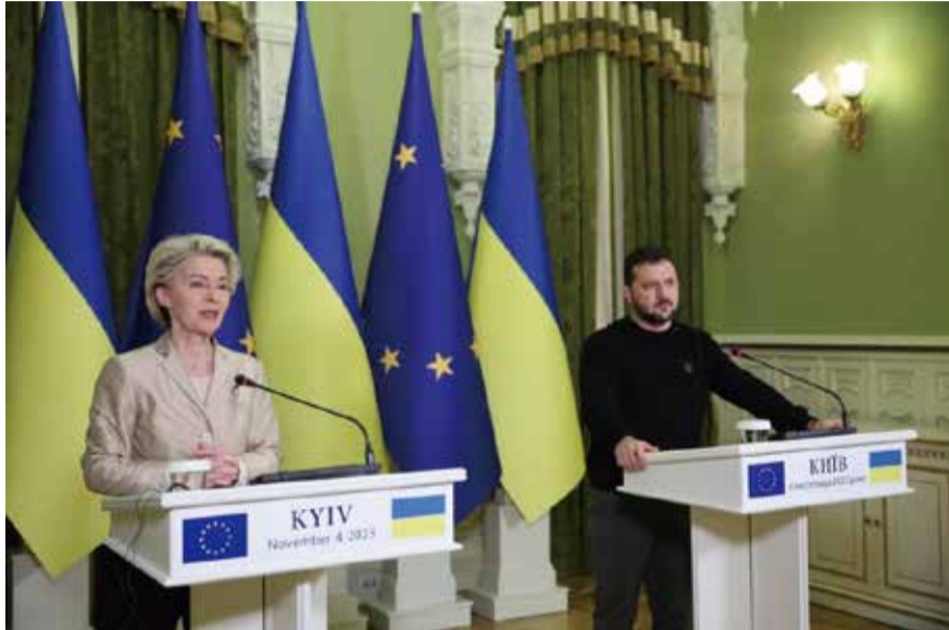
歐洲聯盟執行委員會主席范德賴恩（左）4日訪問烏克蘭，會見烏克蘭總統澤倫斯基（右）。

中華新聞通訊社/中華時報在俄羅斯入侵烏克蘭滿一週年后繼續共同推出專題，以饗讀者，從各個方面探討，讓大家瞭解俄烏戰爭怎麼發展、結局如何和這個21世紀的重大事件。