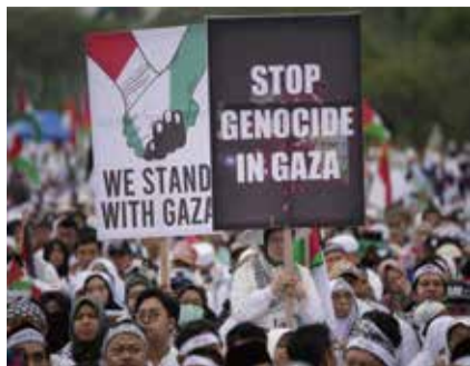
印尼首都雅加達有數萬人集會聲援巴勒斯坦。