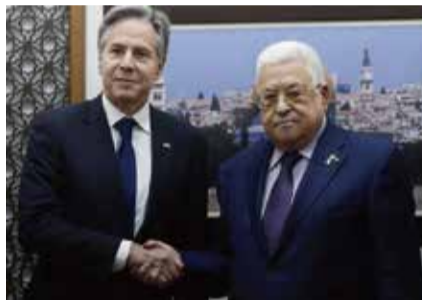
11月5日，美國國務卿布林肯與巴勒斯坦權力機構主席阿巴斯會面。

11月5日，美國國務卿布林肯 (Antony Blinken) 突然訪問了被佔領的約旦河西岸，並會見了巴勒斯坦權力機構主席阿巴斯 (Mahmoud Abbas)。這是拜登政府為緩解巴勒斯坦平民苦難而採取的最新舉措，並開始為該領土勾畫衝突後的前景。