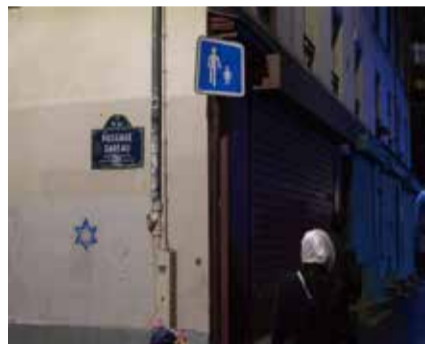
哈馬斯突襲以色列以來，法國記錄到逾一千宗反猶太主義行為，包括有建築物被塗畫大衛之星。