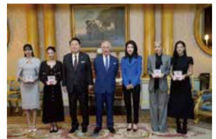
韓國總統尹錫悅(左3)赴英國進行國是訪問，英王查爾斯三世(左4)22日頒發「大英帝國員佐勳章」給隨行的韓國女團BLACKPINK成員。

英韓並已簽署備忘錄建立「潔淨能源夥伴關係」，初期商定聚焦離岸風電及民用核能合作，並將共同開發第三國市場。