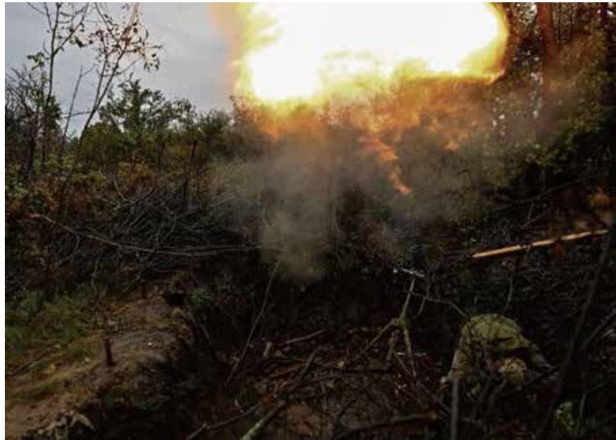
圖為10月一處頓內茨克秘密地點，烏克蘭砲兵向前線開火。

中華新聞通訊社/中華時報在俄羅斯入侵烏克蘭滿一週年後繼續共同推出專題，以饗讀者，從各個方面探討，讓大家瞭解俄烏戰爭怎麼發展、結局如何和這個21世紀的重大事件。