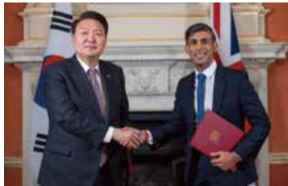
在英國進行國是訪問的南韓總統尹錫悅(左)22日與首相蘇納克(右)舉行雙邊會談，並簽署「唐寧街協議」，其中提到台海和平穩定對國際社會的安全繁榮不可或缺。

【中華新聞通訊社/中華時報11月23日訊】在英國進行國是訪問的南韓總統尹錫悅22日率部長級官員代表團前往唐寧街首相官邸，與蘇納克(Rishi Sunak)、副首相陶敦(Oliver Dowden)，以及內政、商貿、科技、能源等英國部會大臣會談。