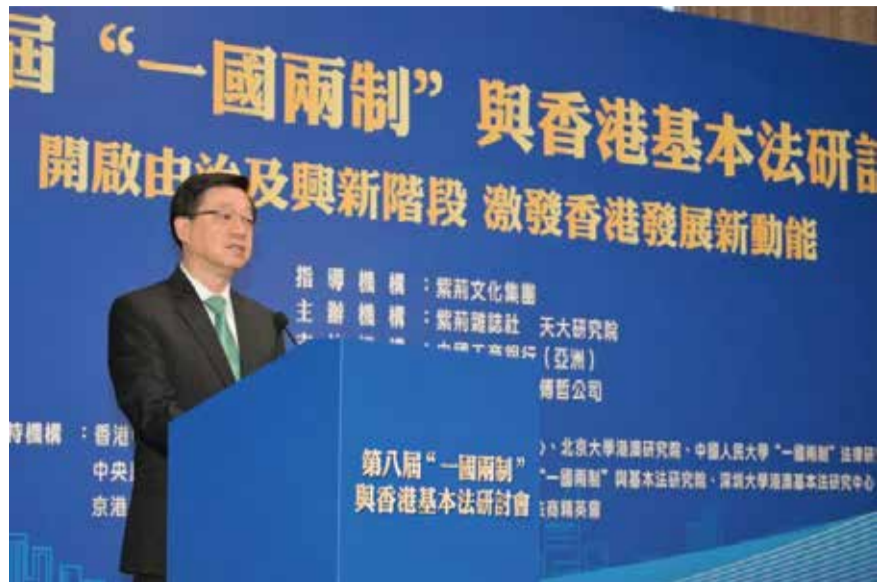
行政長官李家超今早（十一月二十三日）在第八屆「一國兩制」與香港基本法研討會致辭。

（中華新聞通訊社/中華時報11月23日訊）第八屆「一國兩制」與香港基本法研討會今日在港島海逸君綽酒店舉辦，本屆論壇以「開啟由治及興新階段，激發香港發展新動能」為主題。行政長官李家超、中央政府駐港聯絡辦秘書長王松苗出席論壇開幕式並致辭。