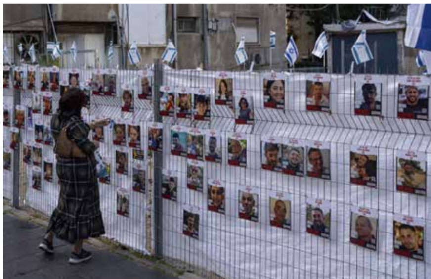
有家屬指，休戰協議只釋放部分人質，擔心被擄走家人不在首批獲釋人質名單上。

【中華新聞通訊社/中華時報11月23日訊】以色列傳媒報道，以色列已收到一份人質名單，這些人質將在與哈馬斯達成的休戰協議生效第一天獲釋。