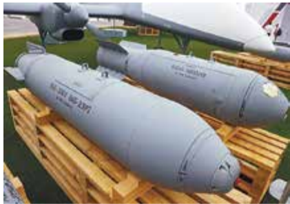
RBK-500集束炸彈據稱可以攜帶126枚重2.5公斤的子彈藥。

據俄羅斯多方消息指出，俄羅斯航空太空軍（VKS）上週首次在俄烏衝突中，使用改良型「滑翔集束炸彈」攻擊烏克蘭軍隊，據稱這種新型炸彈結合了滑翔炸彈飛行距離遠、可於防區外投放、集束炸彈爆炸覆蓋面積廣等特點，使彈藥與飛機皆不易被攔截，有可能改變俄烏戰爭進程。