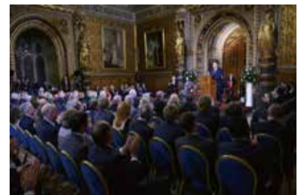
南韓總統尹錫悅21日在英國國會最華麗廳堂之一「皇家畫廊」發表演說，回顧並展望英韓140年來外交關係發展。

韓國總統尹錫悅正在英國進行國是訪問，深化兩國關係。英王查爾斯三世今天頒發英國最高榮譽之一「大英帝國員佐勳章」給隨行的韓國女團BLACKPINK成員，表揚她們倡導環保的努力。查理斯說，希望有一日能夠觀看她們的現場表演。