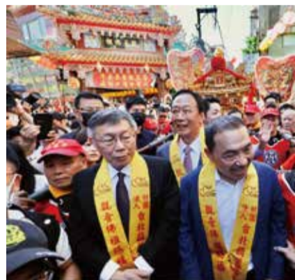
柯文哲已正式邀請郭台銘與國民黨總統參選人侯友宜，今日下午於君悅飯店公開會面。圖為侯友宜（右）、柯文哲（左）、郭台銘（中）11月2日出席台北蘆荊寺觀音佛祖聖誕境起駕大典。

（中華新聞通訊社/中華時報11月23日訊）總統、副總統選舉登記將於明（24）日下午截止，外界關注藍白與無黨籍總統參選人郭台銘是否能成功整合，「藍白拖」今日持續，雙方各自隔空放話，中華新聞通訊社/中華時報整理今日藍白雙方各自的說法與立場。