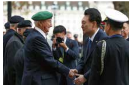
適逢韓戰停火70週年，赴英進行國是訪問的南韓總統尹錫悅21日前往位於倫敦市中心的韓戰紀念碑獻上花圈，並向老兵致敬。

22日在倫敦金融城舉行的「英韓商業論壇」，英國商業暨貿易大臣巴登諾克(Kemi Badenoch)與韓國產業通商資源部部長方文圭共同啟動英韓升級版自由貿易協定(FTA)協商。