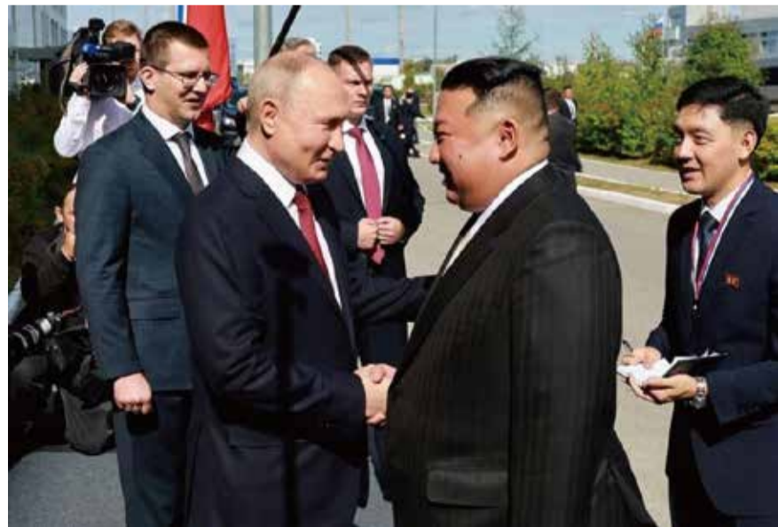
俄國總統普京(前左)與北韓領袖金正恩(前右)9月13日在俄國遠東地區的東方太空發射場會談。

由於以巴衝突與俄侵烏以致中國的對外關係面臨壓力，加上近來俄國總統普京與北韓最高領導人金正恩過從甚密，北京當局極可能正在慎思，中俄兩國原本號稱上不封頂的關係。