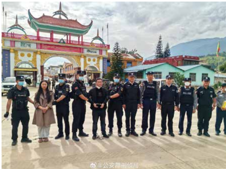
內地公安扣押緬甸接收懷疑是電騙集團重要項目的名氏家族成員。

(中華新聞通訊社/中華時報11月23日訊)中國公安部今天通報，打擊緬甸北部電信網路詐騙犯罪取得顯著戰果，9月迄今累計3.1萬名詐騙犯移交中方。緬北果敢自治區近期陷入戰火，當地詐騙集團瓦解。網路影片顯示，被詐騙園區釋放的大批民眾返回中國。