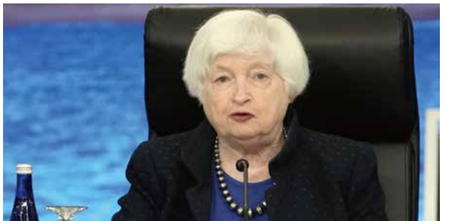
耶倫表示，亞太經合組織成員協調和合作十分重要，而金融和財政政策將是最有效力的工具。