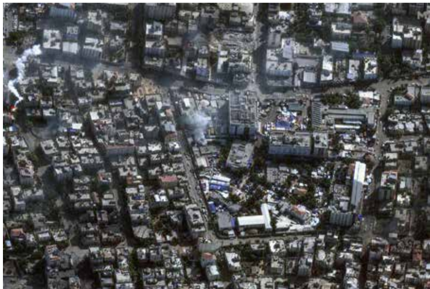
為報復哈馬斯 10 月 7 日對加沙地帶發動的史无前例的襲擊，以色列對加沙地帶進行了長達五周的無情轟炸。

（中華新聞通訊社/中華時報11月14日訊）以色列國防部長加蘭特周一（11月13日）宣稱，哈馬斯「已經失去了對加沙地帶的控制」，哈馬斯武裝人員正在「逃往南部」。美國總統拜登周一要求以色列減少對加沙醫院的攻擊行為。據加沙衛生部稱，加沙最大醫院燃料耗盡，增至34人喪生，包含7嬰兒；哈馬斯武裝團體卡薩