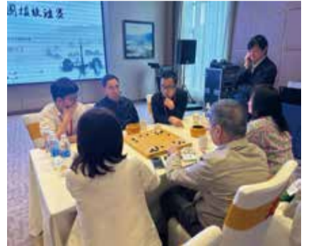
廣東省原省長朱小丹(後中)比賽中