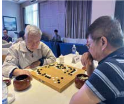
陳丹淮將軍(左)與中山市原副市長馮煜榮在比賽

全國歷史文化名城圍棋賽已經在全國名城舉辦了十六屆，是中國圍棋協會主辦的壹項重要的圍棋賽事，旨在弘揚圍棋文化，促進歷史文化名城間的交流與合作。通過這樣的比賽，不僅可以推動圍棋運動的發展，還可以加強各個歷史名城之間的友誼與合作。