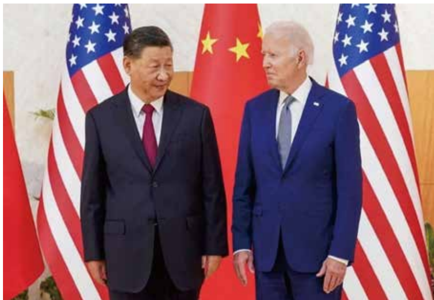
美國總統拜登（右）與中國國家主席習近平（左）去年11月在G20印尼峰會場邊會晤。

（中華新聞通訊社/中華時報11月14日訊）中國國家主席習近平睽違7年將前往美國出席亞太經合會峰會（APEC）並會晤美國總統拜登，連日來，中國輿論從官方媒體到知名博主都表達積極態度。分析家認為，這反映出美中雙方都對此次元首見面有所期待，希望能降低彼此間已經持續一段時間的緊繃態勢。