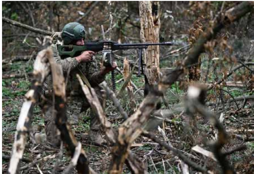
俄羅斯近期加強進攻烏東地區，發動多次進攻，仍被烏軍擊退。圖為烏軍士兵。

中華新聞通訊社/中華時報在俄羅斯入侵烏克蘭滿一週年后繼續共同推出專題，以饗讀者，從各個方面探討，讓大家瞭解俄烏戰爭怎麼發展、結局如何和這個21世紀的重大事件。