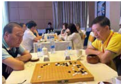
藍曉石將軍(左)與李欣劍將軍(右)對弈